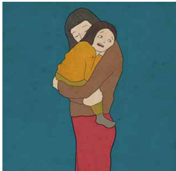
ILLUSTRATION: LOUISE WINBLAD

Läkarmissionens huvudfokus är naturligtvis mammor i utsatthet i olika