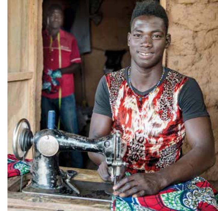
Skräddare i byn Galmi. När man saknar elektricitet gör trampmaskinen jobbet.