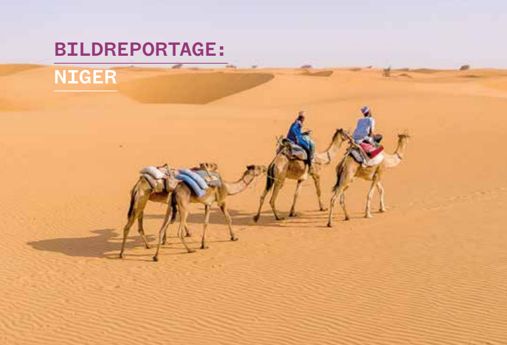
Utanför byn Goudoumaria. Två män på väg till sina odlingslotter som håller på att försvinna på grund av ökenutbredning. Läkarmissionen har borrar brunnar i Diffa-provinsen för befolkningen som lever i ökenlandskapet, men också för att tillgodose behov av rent vatten för de tusentals flyktingar från Nigeria som väller in när gerillan, Boko Haram, terroriserar på andra sidan gränsen.