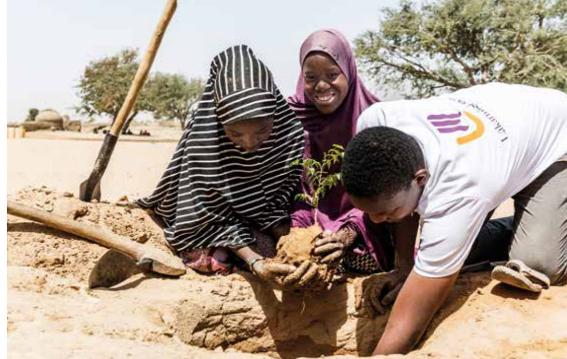
I byn Regou Chenou. Vid varje brunn som Läkarmissionen borrar planteras också ett antal träd. Träden binder jorden och ger så småningom välbehövlig skugga.