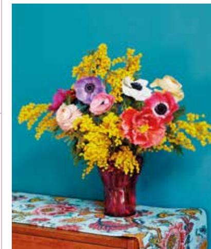
Snittblommor från House Of Flowers såldes till förmånligt pris.

Blommorna såldes till väldigt förmånliga priser och 50 procent av intäkterna donerade Indiska och House Of Flowers till Läkarmissionen.