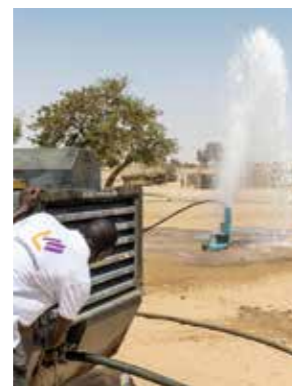
Provtäckning av brunn.

”För mig har det varit självklart att välja ett yrke där jag kan vara med och förändra människors liv.”