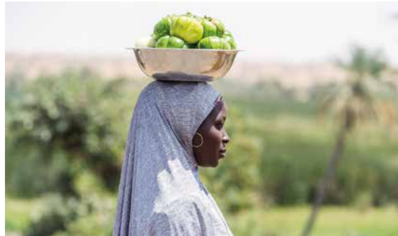
På väg till marknaden i Zinder. Det finns gott om oaser i södra Niger med odlingsmöjligheter. Ofta är dock vattnet i oaserna salthaltigt och odrickbart.