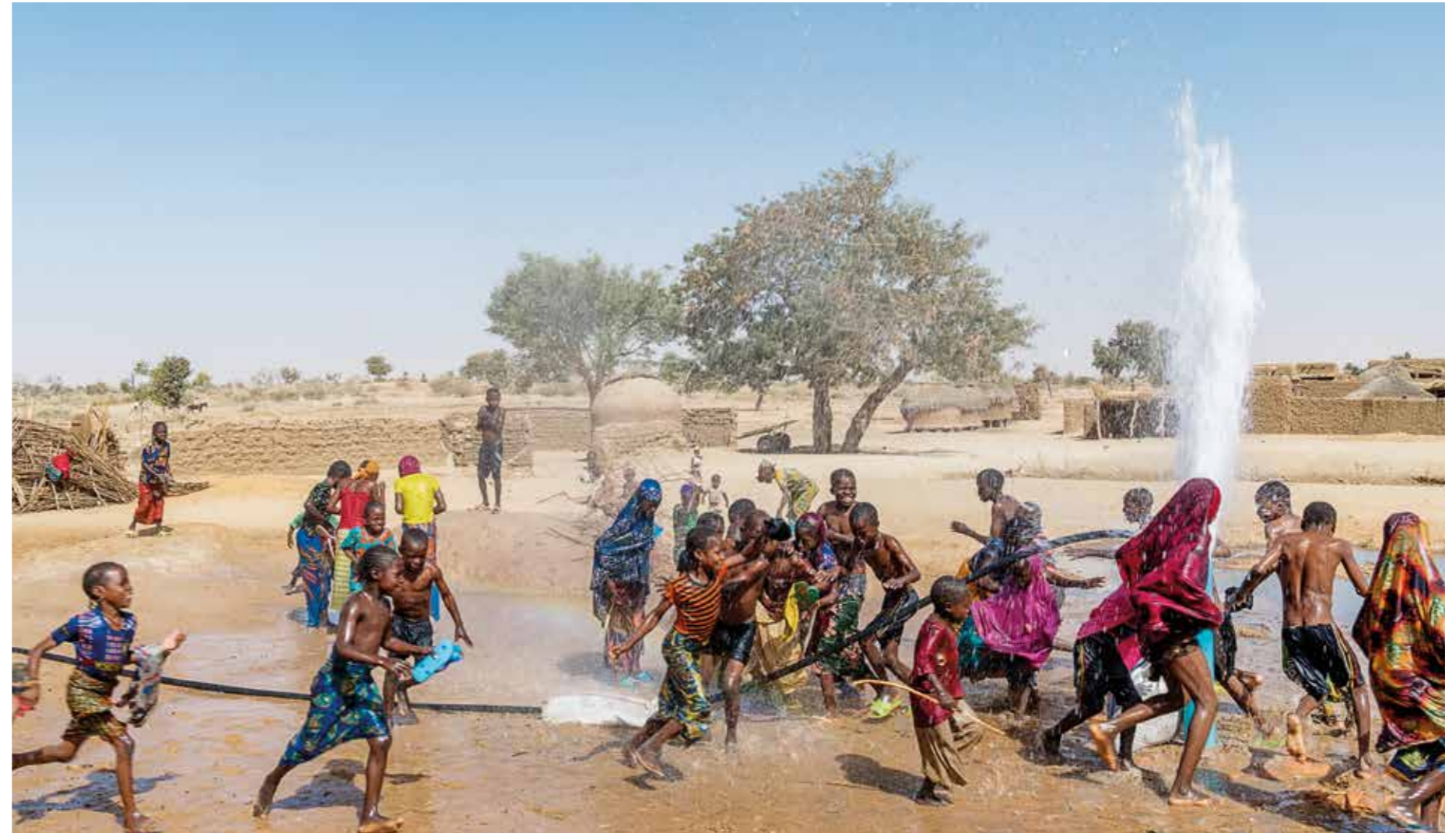
Det lyckade borrhålet i Regou Chenou provtrycks och alla byns barn passar på att få en skön dusch. De sällsynta regnen i Niger kan ibland dunsta innan de når marken.